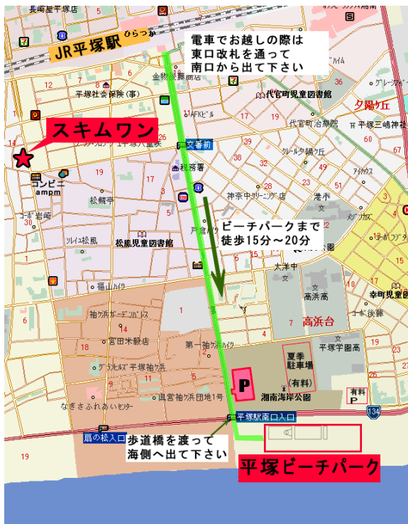
■平塚駅～平塚ビーチパークの地図

お申し込み：4日前までにインターネット( http://www.skim1.com/school/ )にてご予約下さい。