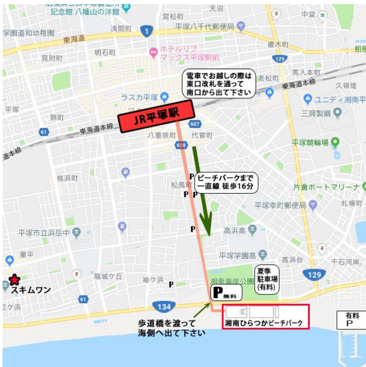
■平塚駅～平塚ビーチパークの地図

お申し込み：4日前までにインターネット ( http://www.skim1.com/school/ ) にてご予約下さい。